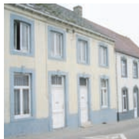
Rue du Pont au Lin, 5-11.