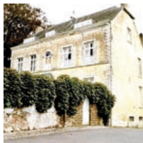
Habitation datant de la 1 ère moitié du 19 ème siècle. Chaussée de Jodoigne, 124.