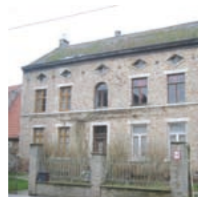
Rue du Pont au Lin, 21 Habitation datant de la 2 ème moitié du 19 ème siècle.